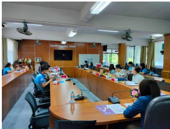
ภาพที่ ๓๓ มีการแลกเปลี่ยนเรียนรู้และให้ข้อมูลป้อนกลับเพื่อปรับปรุงและพัฒนาการจัดการเรียนรู้ทั้งโรงเรียน