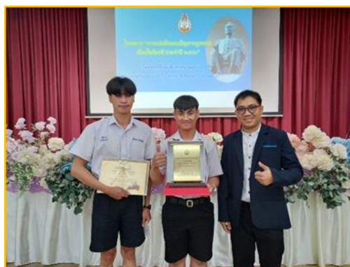
ภาพที่ ๑๒ กิจกรรมส่งเสริมการยกระดับผลสัมฤทธิ์ทางการเรียนตามโครงการยกระดับผลสัมฤทธิ์ กลุ่มสาระการเรียนรู้สังคมศึกษา ศาสนาและวัฒนธรรม