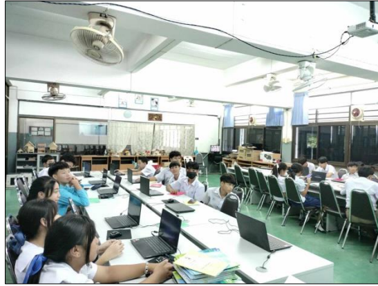
ภาพที่ ๓๐ จัดการเรียนรู้โดยใช้สื่อ เทคโนโลยีสารสนเทศ และแหล่งเรียนรู้ที่เอื้อต่อการเรียนรู้