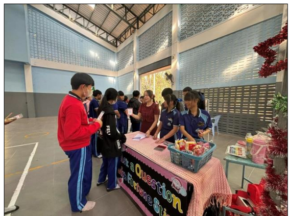
ภาพที่ ๙ กิจกรรมส่งเสริมการยกระดับผลสัมฤทธิ์ทางการเรียนตามโครงการยกระดับผลสัมฤทธิ์ กลุ่มสาระการเรียนรู้ภาษาต่างประเทศ