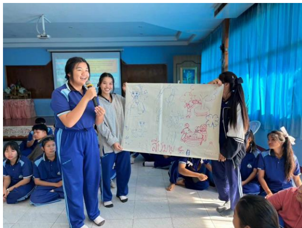
ภาพที่ ๒ กิจกรรมเพื่อส่งเสริมและพัฒนาทักษะการคิดวิเคราะห์ ให้กับผู้เรียนด้วยการจัดค่ายส่งเสริมวิชาการ