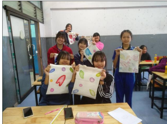
ภาพที่ ๒๙ จัดการเรียนรู้จัดการเรียนรู้ผ่านกระบวนการคิดและปฏิบัติจริง และสามารถนำไปประยุกต์ใช้ในการดำเนินชีวิต