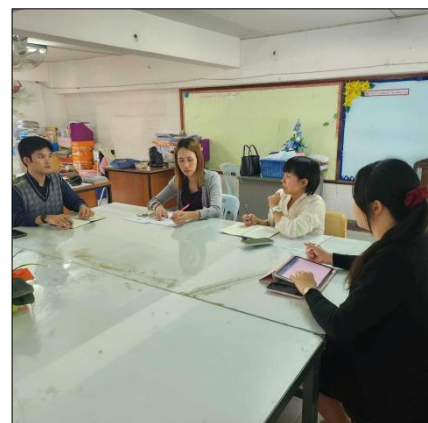
ภาพที่ ๓๒ มีการแลกเปลี่ยนเรียนรู้และให้ข้อมูลป้อนกลับเพื่อปรับปรุงและพัฒนาการจัดการเรียนรู้ กลุ่มสาระการเรียนรู้