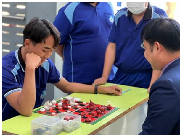
ภาพที่ ๓ กิจกรรมส่งเสริมความสามารถในการคิดคำนวณ