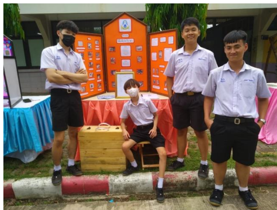
ภาพที่ ๑๕ โครงการศึกษาเพื่อการมีงานทำ