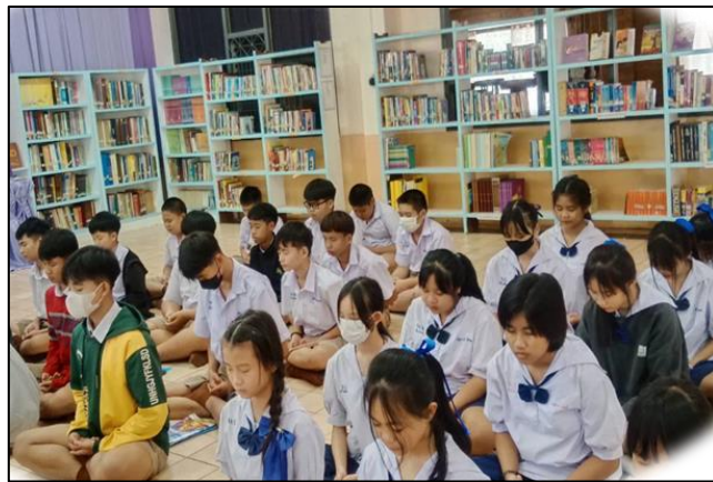
ภาพที่ ๒๐ มีสุขภาวะทางร่างกายและลักษณะจิตสังคม