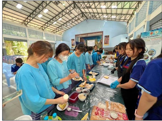
ภาพที่ ๑๓ โครงการศึกษาเพื่อการมีงานทำ