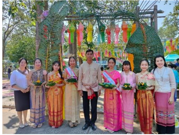
ภาพที่ ๑๙ นักเรียนมีความภูมิใจในท้องถิ่นและความเป็นไทย