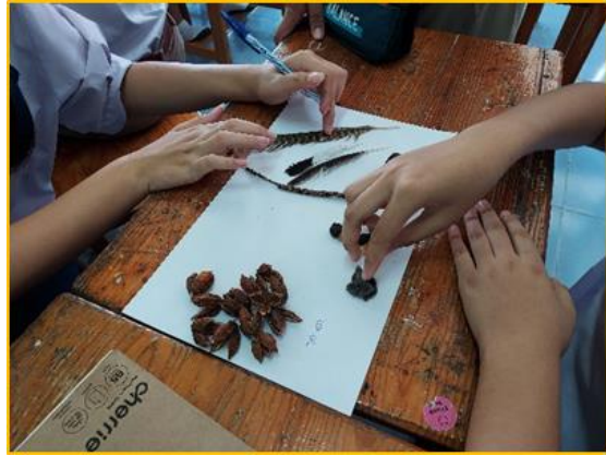
ภาพที่ ๒๕ โรงเรียนมีการจัดสภาพแวดล้อมทางกายภาพและสังคมที่เอื้อต่อการจัดการเรียนรู้