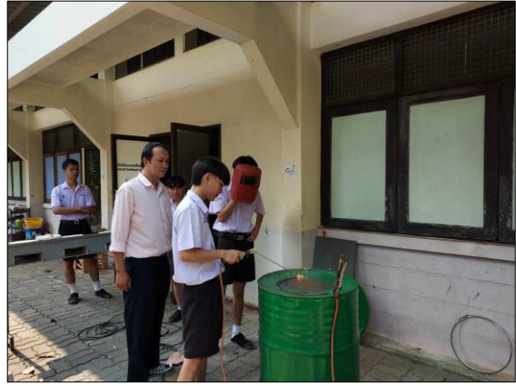
ภาพที่ ๗ กิจกรรมส่งเสริมความสามารถในการสร้างนวัตกรรม