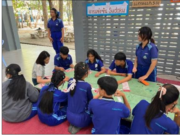
ภาพที่ ๔ กิจกรรมยกระดับผลสัมฤทธิ์สาระคณิตศาสตร์