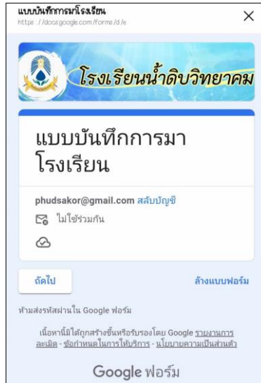
ภาพที่ ๒๘ จัดระบบเทคโนโลยีสารสนเทศเพื่อสนับสนุนการบริหารจัดการและการจัดการเรียนรู้ระบบติดตามการมาเรียนและเข้าชั้นเรียน

มาตรฐานที่ ๓ ด้านกระบวนการจัดการเรียนการสอนที่เน้นผู้เรียนเป็นสำคัญ แสดงผลการจัดการศึกษาตามมาตรฐานที่ ๓ ด้านกระบวนการจัดการเรียนการสอนที่เน้นผู้เรียนเป็นสำคัญ