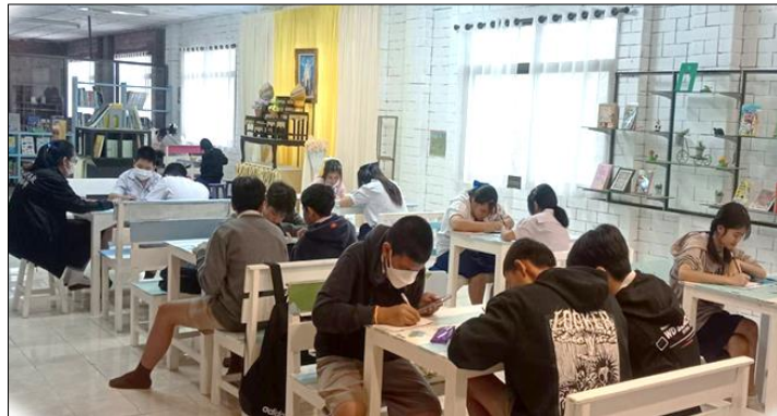
ภาพที่ ๑ กิจกรรมส่งเสริมความสามารถในการอ่าน การเขียน การสื่อสาร เพื่อพัฒนาทักษะด้านภาษา การจัดบันทึกการอ่าน