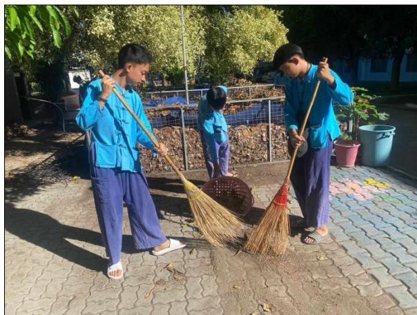
ภาพที่ ๑๗ นักเรียนมีคุณลักษณะที่พึงประสงค์และมีค่านิยมที่ดีตามที่สถานศึกษากำหนด