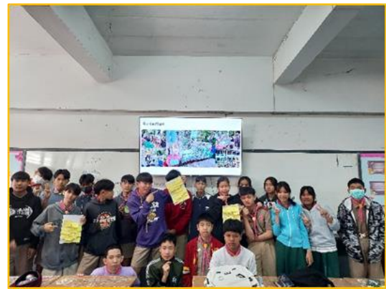
ที่ ๓๑ มีการบริหารจัดการชั้นเรียนเชิงบวก