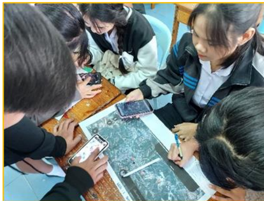
ภาพที่ ๖ กิจกรรมส่งเสริมความสามารถในการคิดวิเคราะห์ คิดอย่างมีวิจารณญาณอภิปรายแลกเปลี่ยน ความคิดเห็น และแก้ปัญหาโดยใช้เทคโนโลยี