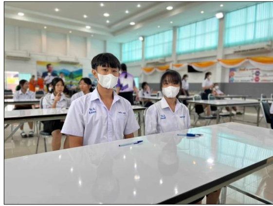
ภาพที่ ๑๐ กิจกรรมส่งเสริมการยกระดับผลสัมฤทธิ์ทางการเรียนตามโครงการยกระดับผลสัมฤทธิ์ กลุ่มสาระการเรียนรู้สุขศึกษาและพลศึกษา