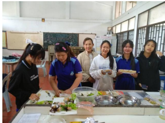
ภาพที่ ๒๖ โรงเรียนมีการจัดสภาพแวดล้อมทางกายภาพและสังคมที่เอื้อต่อการจัดการเรียนรู้