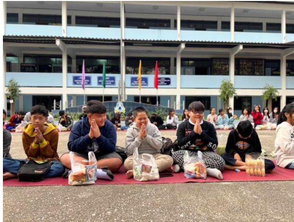
ภาพที่ ๑๖ นักเรียนมีคุณลักษณะที่พึงประสงค์และมีค่านิยมที่ดีตามที่สถานศึกษากำหนด