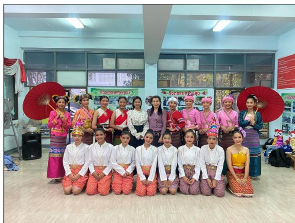
ภาพที่ ๑๘ นักเรียนมีความภูมิใจในท้องถิ่นและความเป็นไทย