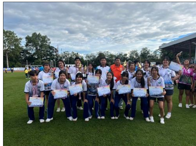
ภาพที่ ๒๑ มีสุขภาวะทางร่างกายและลักษณะจิตสังคม