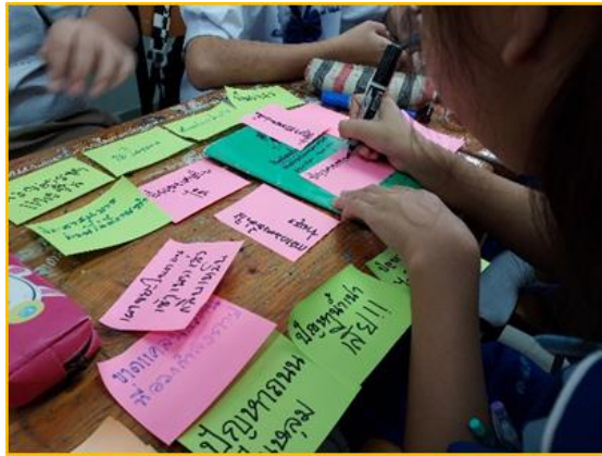
ภาพที่ ๕ กิจกรรมส่งเสริมความสามารถในการคิดวิเคราะห์ คิดอย่างมีวิจารณญาณอภิปรายแลกเปลี่ยนความคิดเห็น และแก้ปัญหา