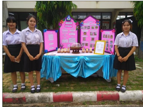
ภาพที่ ๑๔ โครงการศึกษาเพื่อการมีงานทำ