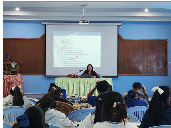
ภาพที่ ๑๑ กิจกรรมส่งเสริมการยกระดับผลสัมฤทธิ์ทางการเรียนตามโครงการยกระดับผลสัมฤทธิ์ กลุ่มสาระการเรียนรู้ภาษาไทย