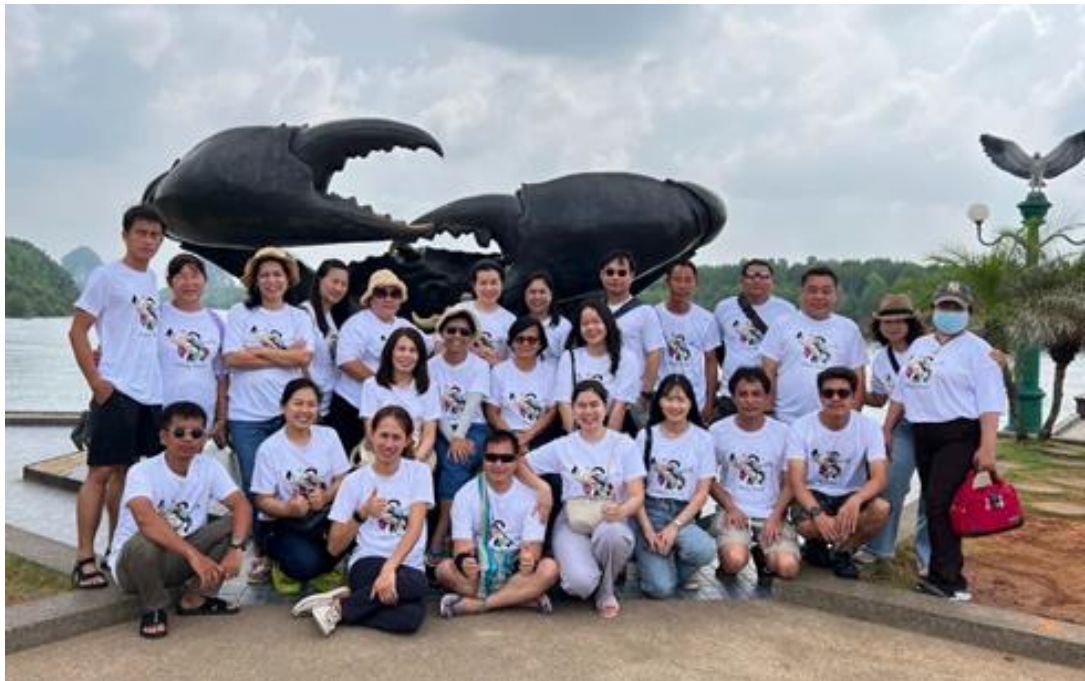
การศึกษาดูงาน จังหวัดกระบี่