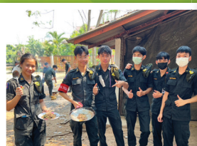
ค่ายนักศึกษาวิชาทหาร ณ ศูนย์การฝึกนักศึกษาวิชาทหารมณฑลทหารบกที่ 33