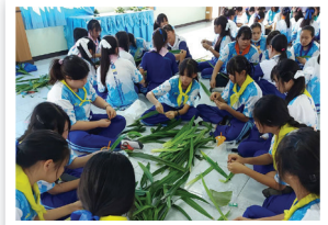
ค่ายชุกกาชาด โรงเรียนน้ำตบวิทยา ดม และก๊อม่่วงปาน