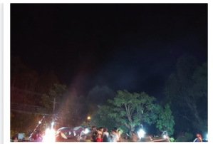
ค่ายลูกเสือ ณ สถานีควบคุมไฟฟ้าอินทนนท์