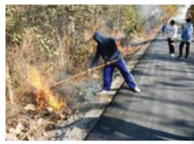
ลูกเสือทำแนวกันไฟ ณ ป่าชุมชน บ้านนัวน้อย