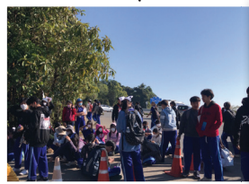
ค่ายนักอนุรักษ์ โรงเรียนน้ำตบวิทยา ดม และก๊อม่่วงปาน