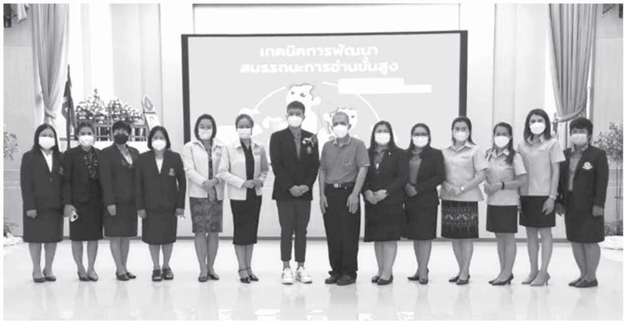
ครูกลุ่มสาระการเรียนรู้ภาษาไทยอบรมเทคนิคการพัฒนาสมรรถนะการอ่านขั้นสูง ณ โรงเรียนจักรคำคณาทร

จัดแสดงนิทรรศการและนำเสนอผลการดำเนินงานของโรงเรียน ในการนิเทศติดตามการขับเคลื่อนโครงการ “การพัฒนาสมรรถนะการอ่านขั้นสูงสำหรับนักเรียนชั้นมัธยมศึกษาตอนต้น” ของสถานศึกษา โดยสำนักงานคณะกรรมการการศึกษาขั้นพื้นฐาน นำโดย ดร.กวิทร์เกียรติ นนธ์พละ รองเลขาธิการคณะกรรมการการศึกษาขั้นพื้นฐาน ณ โรงเรียนจักรคำคณาทร ลำพูน เมื่อวันที่ 23 มีนาคม 2565