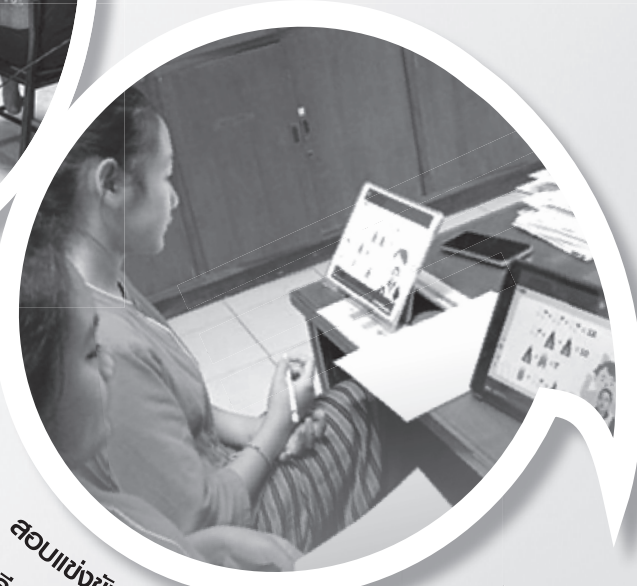
สอนแต่งชั้นทักษะวิชาการออนไลน์ร่วมกับ โรงเรียนส่วนบุญโญปถัมภ์ ลำพูน วันที่ 23 กพ. 2565