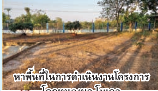
หาพื้นที่ในการดำเนินงานโครงการ โคกหนองนา โมเดล

เขตพื้นที่การศึกษามัธยมศึกษา ลำปาง ลำพูน สำนักงานคณะกรรมการการ ศึกษาขั้นพื้นฐาน กระทรวงศึกษาธิการ