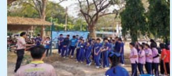
เครือข่ายความร่วมมือของโรงเรียน 4 โรงเรียน ในการขับเคลื่อนโครงการ โคก หนอง นา โมเดล สู่สถานศึกษาจังหวัดลำพูน