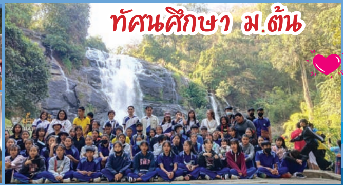
ทัศนศึกษา ม.ต้น