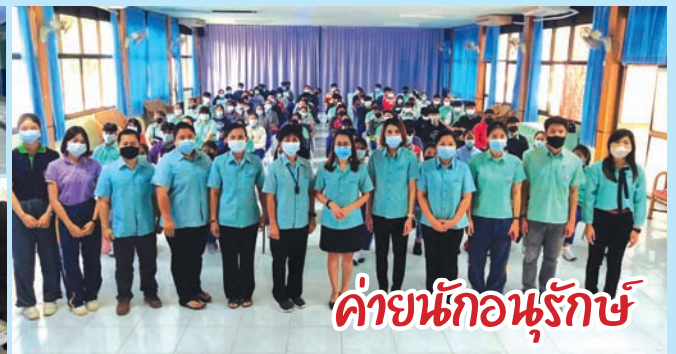
ค้ายนักอนุรักษ์