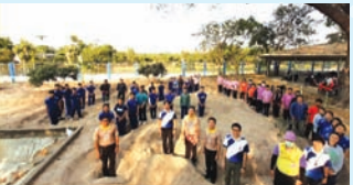
กิจกรรมขุดหนอง และขุดนา “เอามื้อสามัคคี”