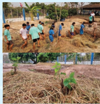
กิจกรรมย่ำซีเสริมฟาง บริเวณหนองนา และปลูกป่า 5 ระดับ