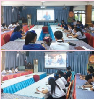
ประชุมการดำเนินงาน และศึกษาองค์ความรู้ เรื่อง โคก หนอง นา โมเดล ของนักเรียนแกนนำโคก หนอง นา