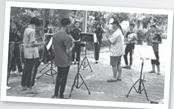
เข้าค่ายอบรมวงดนตรีโยธวาทิต