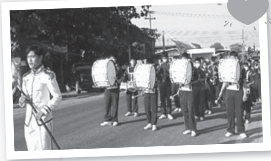
วงโยธวาทิตเข้าร่วมเดินขบวนงานกีฬาตำบลวังยาง