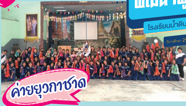
ค้ายยุวกาชาด