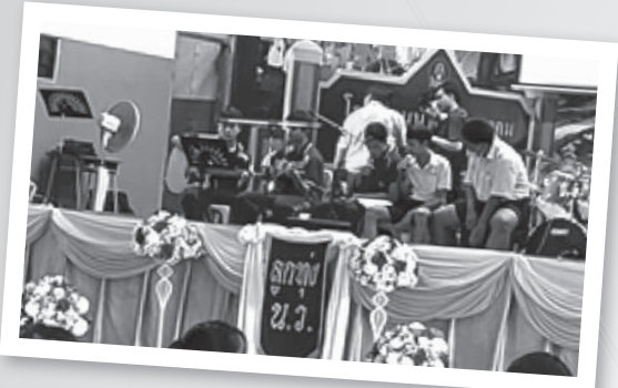
การแสดงดนตรีลูกทุ่งงานลอยกระทง