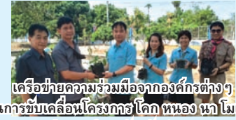
เครือข่ายความร่วมมือจากองค์กรต่างๆ ในการขับเคลื่อนโครงการโคก หนอง นา โมเดล สู่สถานศึกษาจังหวัดลำพูน