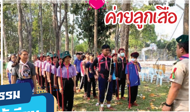
ค้ายลูกเสือ