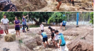
กิจกรรมหมักคองดิน