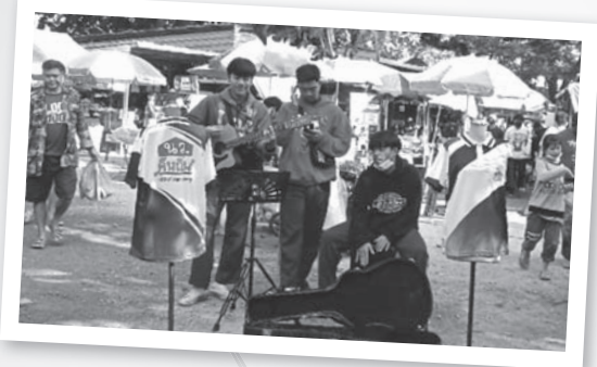
นำนักดนตรีโฟล์คของบรรเลงตลาดนัดบ้านเวียง