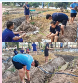
กิจกรรมปลูกหญ้าแฝก รอบหนองน้ำ