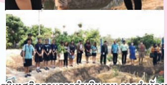
การนิเทศติดตามการดำเนินงาน จากสำนักงาน คณะกรรมการการศึกษาขั้นพื้นฐาน