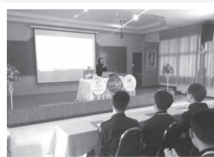
การจัดตัว โครงการ English We like ของ บริษัท Farmhouse