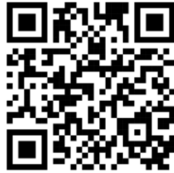
O7 - O13_qrcode